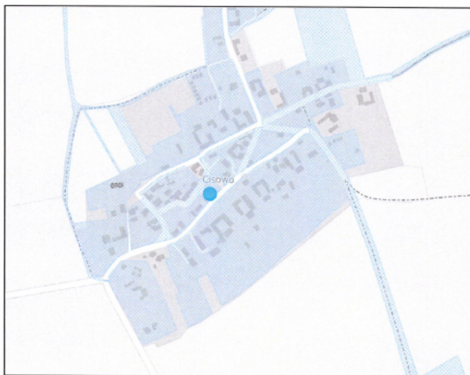
Mapa miejscowości Cisowo. Niebieski punkt wskazuje działkę nr 288/2. Obszar rewitalizacji obejmuje tereny oznaczone niebieską kratką.